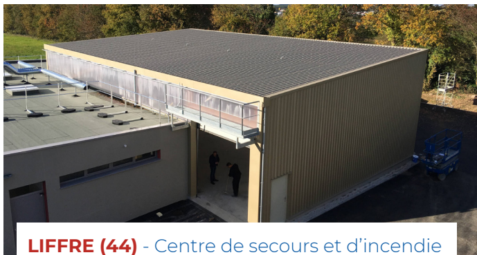
LIFFRE (44) - Centre de secours et d'incendie Architecte : Robaglia