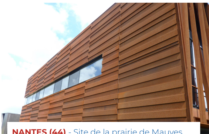
NANTES (44) - Site de la prairie de Mauves Architecte : Atelier Arcau