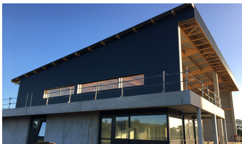
HERIC et BOUVRON (44) - Centre de transfert de déchets Architecte : Cabinet Bourgois