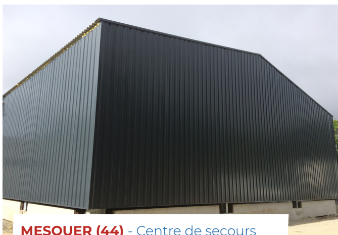
MESQUER (44) - Centre de secours Architecte : SCP Forest Debarre