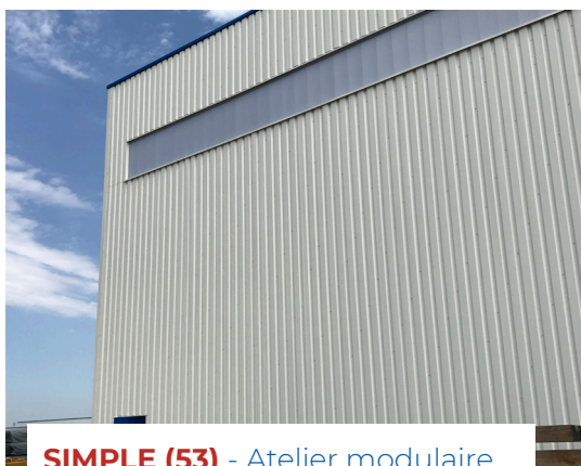
SIMPLE (53) - Atelier modulaire Cruard Charpente