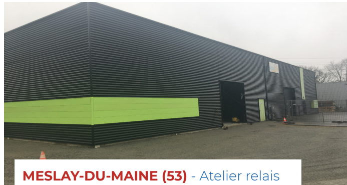
MESLAY-DU-MAINE (53) - Atelier relais Maître d'oeuvre : Bati France Ingénierie