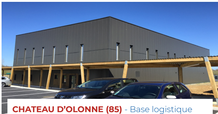
CHATEAU D'OLONNE (85) - Base logistique Architecte : CAN Ingénieurs Architectes