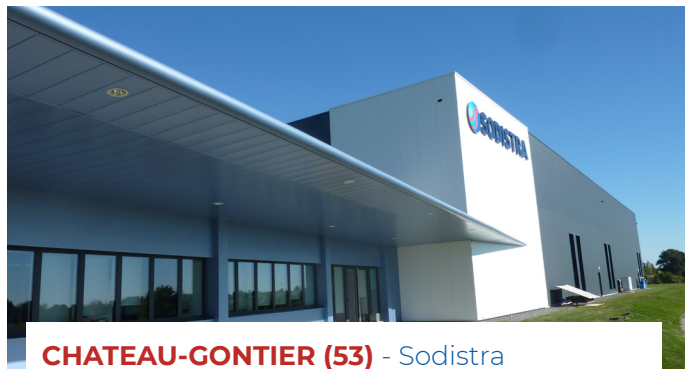
CHATEAU-GONTIER (53) - Sodistra Architecte : Interfaces 3D